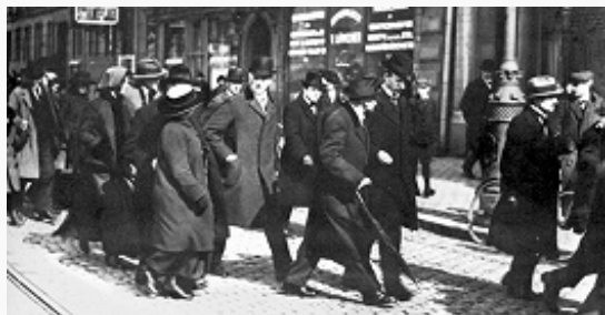
В. И. Ленин в Стокгольме с группой политэмигрантов по пути из Швейцарии в Россию. 31 марта (13 апреля) 1917. Фото.

органом являлся Большевистский центр (состоял из членов расширенной редакции фракционной газ. «Пролетарий»). В 1907 Б. признали ошибочность бойкота Гос. думы, придерживались тактики «левого блока» на выборах во 2-ю Гос. думу.