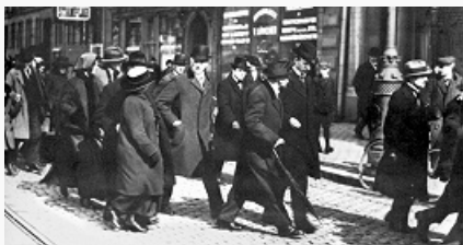
В. И. Ленин в Стокгольме с группой политэмигрантов по пути из Швейцарии в Россию. 31 марта (13 апреля) 1917. Фото.

организациями, применявшими насильственные методы борьбы, в т. ч. при подготовке и проведении Декабрьских вооружённых восстаний 1905. Рассчитывая на вооруж. свержение самодержавия, Б. бойкотировали выборы в 1-ю Гос. думу. В 1907–10 фракционным руководящим органом являлся Большевистский центр (состоял из членов расширенной редакции фракционной газ. «Пролетарий»). В 1907 Б. признали ошибочность бойкота Гос. думы, придерживались тактики «левого блока» на выборах во 2-ю Гос. думу.