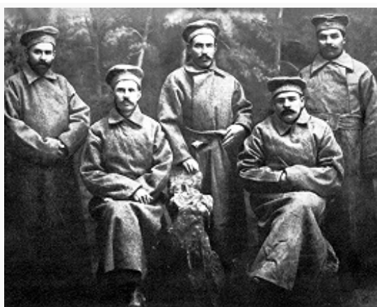
Большевики – депутаты 4-й Государственной думы в ссылке: Г. И. Петровский, Ф. Н. Самойлов, М. К. Муранов, А. Е. Бадаев, Н. Р. Шагов. Фото. 1914.

РСДРП Ленин предложил считать условием членства в партии личное участие в работе одной из парт. организаций. В основе позиции Ленина лежала концепция партии как нелегальной централизованной организации проф. революционеров, пригодной для конспиративной деятельности и захвата власти. Ей соответствовал исключит. авторитет Ленина – лидера и гл. идеолога Б. Состав руководства Б. менялся, первоначально в ближайшее окружение В. И. Ленина входили А. А. Богданов, В. В. Воровский, Г. М. Кржижановский, Л. Б. Красин, А. В. Луначарский, М. С. Ольминский и др.; почти все они в разное время объявлялись недостаточно последовательными Б. или «примиренцами».