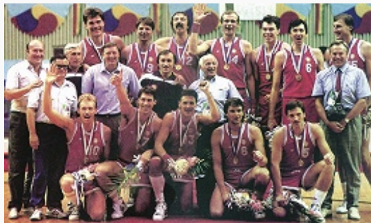
Сборная СССР – чемпион Олимпийских игр в Сеуле (1988).

БАСКЕТБОЛ (от англ. basket – корзина и ball – мяч), командная спортивная игра, цель которой забросить руками мяч в подвешенную корзину. Площадка 26×14 м, корзина укреплена на щите (на выс. 3,05 м), мяч 75–78 см в окружности, масса 600–650 г. Игра в 2 тайма (каждый из них делится на 2 периода со сменой сторон) по 20 мин т. н. чистого времени (когда мяч находится в игре) с 10-минутным перерывом. При ничейном результате назначается дополнит. время – 5 мин; от каждой команды на площадке по 5 игроков, замены не ограничены. Мяч можно передавать, бросать, вести в любом направлении (т. н. дриблинг) только руками в соответствии с правилами. За мяч, заброшенный с игры, засчитывается 2 очка (из-за линии трёх очков – 3 очка), со штрафного – 1 очко.