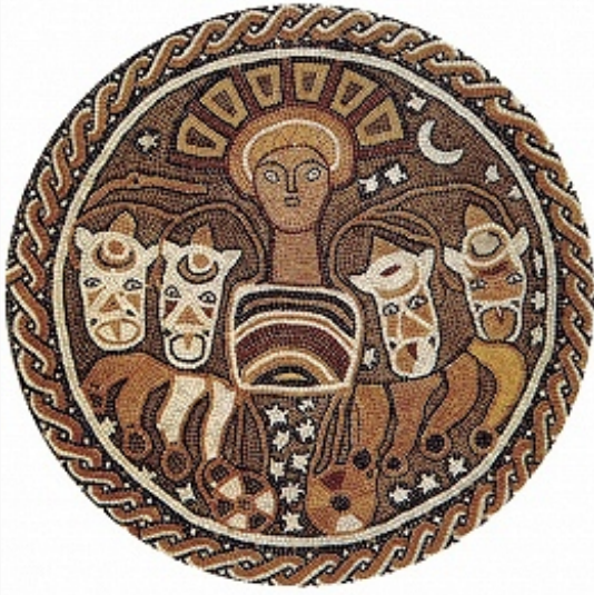
Гелиос на колеснице (центральный фрагмент зодиакального круга). Мозаика пола древней синагоги в Бет-Альфе. 6 в. н. э.

расположенные при входе в центр. неф гл. зала синагоги и украшенные изображениями льва (справа) и быка (слева). Текст на арамейском яз. гласит, что мозаика изготовлена при имп. Юстине I ; текст на греч. яз. содержит имена мастеров – Марианос и его сын Ханина.