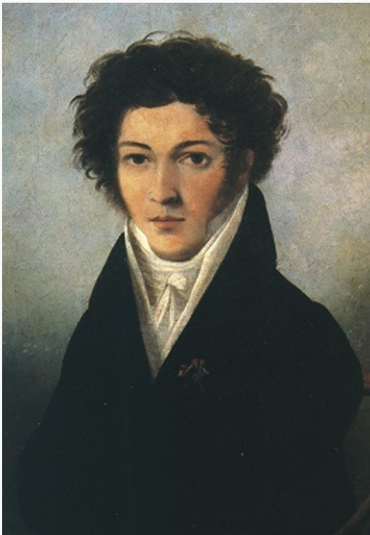
К. Н. Батюшков. Портрет работы неизвестного художника. 1810-е гг.

БАТЮШКОВ Константин Николаевич [18(29).5.1787, Вологда – 7(19).7.1855, там же], рус. поэт. Дворянин. Двоюродный племянник М. Н. Муравьёва . Учился в петерб. частных пансионах (1797–1802), с 1802 сотрудник деп-та Мин-ва нар. просвещения. В 1807–09 участник воен. действий рус. армии в Пруссии, Финляндии; был тяжело ранен. Выйдя в отставку, сблизился с В. А. Жуковским , П. А. Вяземским , В. Л. Пушкиным . В 1813–15 Б. вновь в действующей армии. Осенью 1815 заочно принят в члены лит. об-ва «Арзамас» . В 1817 вышли два тома сочинений Б. – «Опыты в стихах и прозе». В 1818 Б. причислен к рус. дипломатич. миссии в Италии. В нач. 1820-х гг. обострилось тяжёлое наследственное психич. заболевание Б. В 1824–28 он находился в