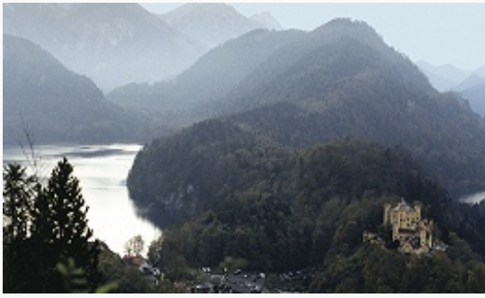
Баварские Альпы.

(принадлежал ей в 1268–1329) и стала крупнейшим территориальным княжеством Германии. Попытки Реформации в Б. были подавлены. Баварские герцоги вместе с Габсбургами возглавили Контрреформацию в Германии (см. Католическая лига 1609 ). С 1623 курфюршество. К кон. 17 в. в Б. сложился княжеский абсолютизм. В составе католич.