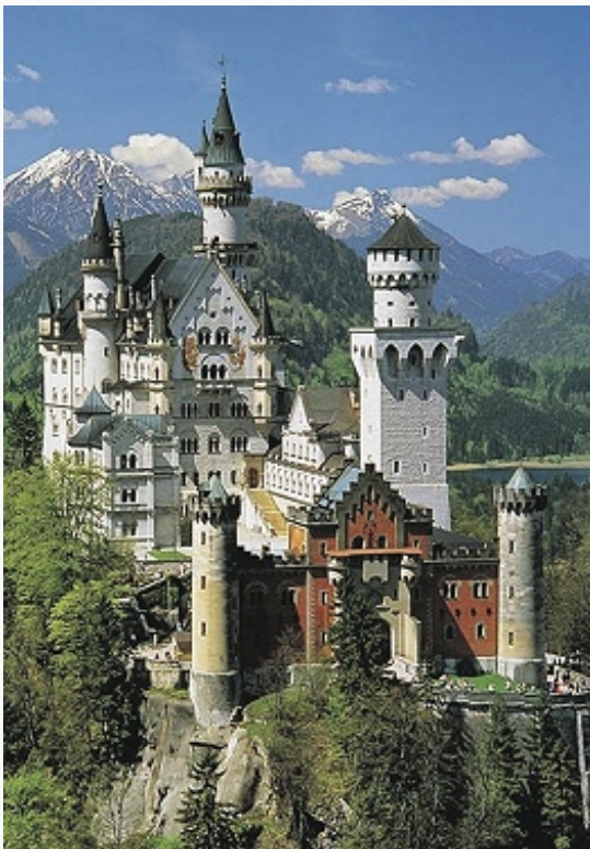
Королевский замок Нойшванштайн. Построен в 1868–86 по плану Х. Янка в неоромантическом стиле.

В 1818 в Б. была принята конституция и учреждён двухпалатный парламент. В 1832 в Рейнском Пфальце либеральные круги организовали манифестацию под лозунгом объединения Германии и проведения реформ (см. Гамбахское празднество ). В период Революции 1848–49 в Германии Рейнский Пфальц стал одним из центров вооруж. восстания (подавлено прус. войсками), в Б. была отменена часть крестьянских повинностей.