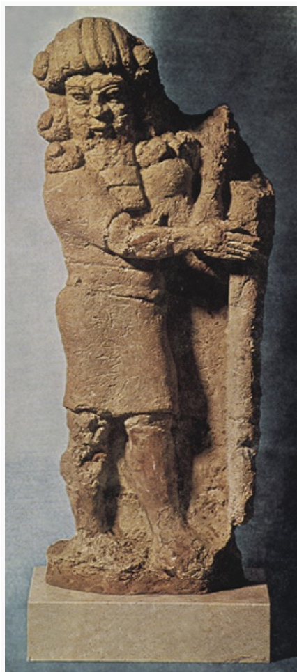
Гильгамеш. 8 в. до н. э. Лувр (Париж).