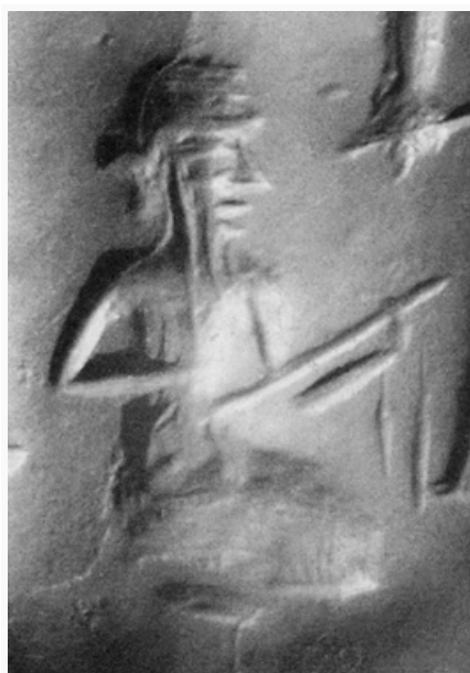
«Музыкант с лютней». Деталь

АККА́Д (Аккаде, Агаде), древний город в сев. части Нижней Месопотамии, точное местоположение которого неизвестно (возможно, близ г. Сиппар; совр. Абу-Хабба, Ирак). А. имел бухту и пристань, куда прибывали суда из далёких стран. Покровительницей города считалась богиня Иштар , которой был посвящён храм Эулмаш. В 24–22 вв. до н. э. А. стал центром одним. государства, включившего всю Нижнюю Месопотамию и установившего своё влияние над Эламом. Позднее назв. «А.» распространилось на историч. область Ср. Двуречья. Возвысил город и стал основателем гос-ва Аккад Саргон Древний (аккад. Шаррумкен – «Царь истинен»), правивший в 2316–2261 до н. э. С него началась династия Саргонидов, представленная его сыновьями Римушем и Маништушу, внуком Нарам-Суэном, правнуком Шаркалишарри и др. менее известными правителями. Ещё при Саргоне под власть А. попал Шумер после разгрома им союза шумерских номов во главе с его лидером Лугалзагеси . Однако сепаратистские настроения и мятежи там не прекращались. Саргониды вели активную внешнюю политику, совершая походы на север Двуречья, в Малую Азию, Элам, морские экспедиции вдоль побережий Персидского зал. и на его острова, нападая на Эблу в Сирии, воюя с луллубеями в горах Ирана. Сам Саргон, напр., участвовал в 34 сражениях и был прославлен в поэме «Царь битвы».